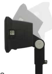
EM-12 Наклоняемое крепление индикатора