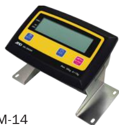
EM-14 Стойка дисплея для размещения на столе/стене