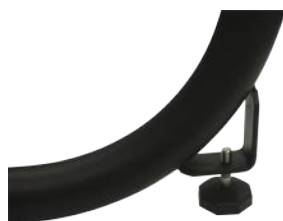
EM-13 Дополнительная опора